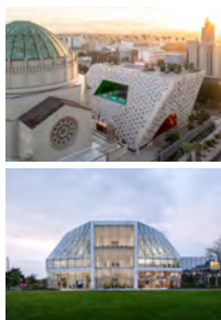
パヴァロー AGK 美術館