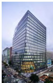
天神ビジネスセンター