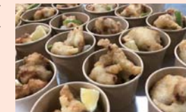
オードブルビュッフェ(とり天)

開演後は、しばしの懇親の後に協力会の主催によるマジックショーを予定しています。また料理は、大分県産の名物料理を中心としたオードブルビュッフェをご用意しております。特に昭和20～30年代に大分から始まったとされる「とり天」をご賞味ください。ウェルカムパーティー後は、別府の地域色ある街と温泉をお楽しみください。