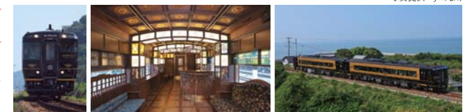
特急「A列車で行こう」

11:00頃 別府駅出発 → 昼食(車内) → 12:20頃 JR由布院駅到着 → 湯布院自由散策(2時間) → 15:00頃 JR由布院駅出発 → 16:15頃 別府駅 → 17:00頃 ビーコンプラザ到着