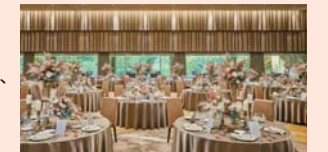
レセプションパーティー会場

会場では、大分別府の山々の景色を望む開放的な大型オープンテラスが併設されており、別府の景色を楽しむことができます。