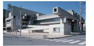
会場のアートプラザ